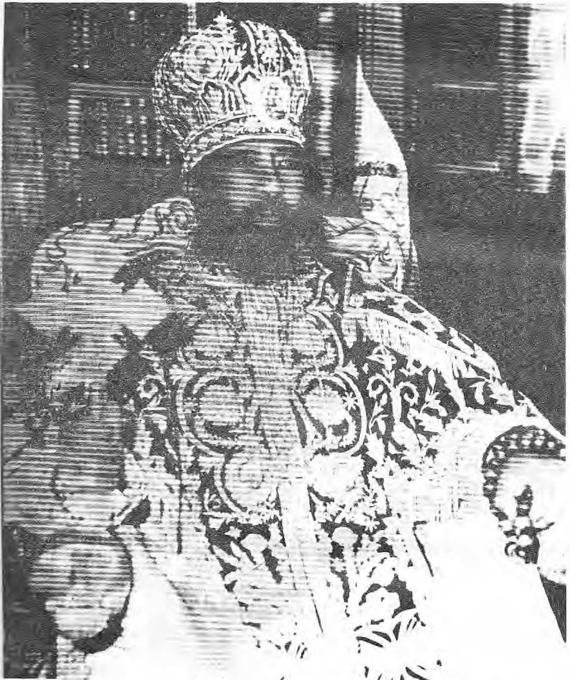
በፁዕ ወቅዱስ እቡነ ጳውሎስ ፓትርያርክ ርእሰ ሊቃነ ጳጳሳት ዘኢትዮጵያ ሊቀ ጳጳስ ዘአክሱም ወአጪጊ ዘመንበረ ተክለ ሃይማኖት